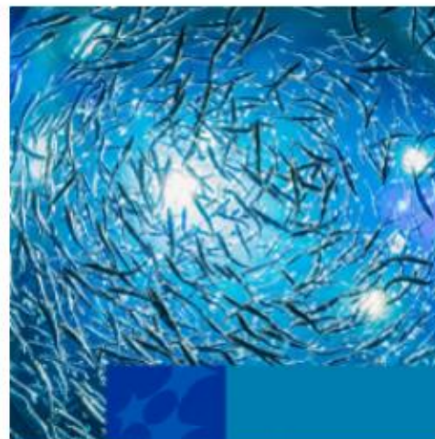
Rybacktwo i Rybołówstwo